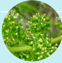
Fleur de vigne